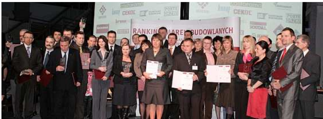
Zwycięscy Rankingu Marek Budowlanych 2007

Głównym zwycięzcą rankingu (notabene - trzeci raz z rzędu) została Grupa Atlas , którą 2050 respondentów uznało Budowlaną Marką Roku. Wyróżnienie to jest tym bardziej znaczące, gdyż oceny marek budowlanych dokonywali przedstawiciele firm wykonawczych, na co dzień korzystający z szerokiego asortymentu rynku budowlanego.